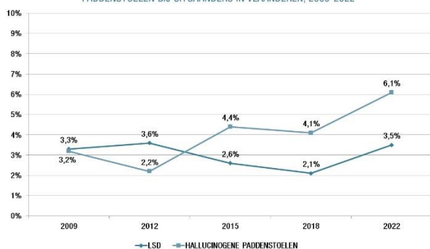
EVOLUTIE VAN HET LAATSTEJAARSGEBRUIK VAN LSD EN HALLUCINOGENE PADDENSTOELEN BIJ UITGAANDERS IN VLAANDEREN, 2009-2022

Het percentage uitgaanders dat het laatste jaar hallucinogene paddenstoelen nam, kende sinds 2012 een heropleving. Tussen 2012 en 2022 verdrievoudigde het laatstejaarsgebruik van hallucinogene paddenstoelen in het uitgaansleven. Ook het laatstejaarsgebruik van lsd kende na een daling tussen 2012 en 2018 een heropflakking in 2022.